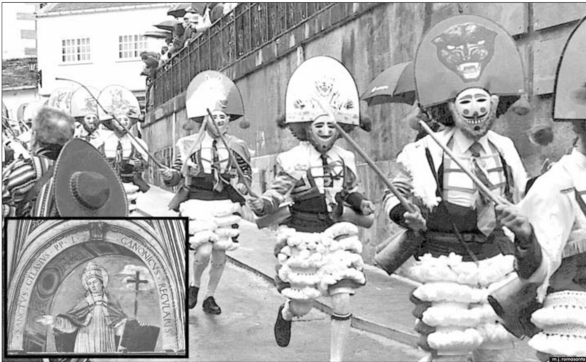
Os peliqueiros baixan dende a praza da Picota de Laza, nun ritual que pervive dende a romanización. No século V, o Papa Xelasio (recadro) xa tentou prohibir as festas Lupercais.

Cando o Papa Xelasio ascendeu á cúspide da Igrexa, atopou un panorama desolador. A presión dos godos ameazaba á Cidade Eterna, e o paganismo e novas herexías coma o maniqueísmo dividían a fe. Entón, decidiu emprender una serie de reformas que acabarían coa instauración dos catro evanxeos oficiais e a prohibición dunha curiosa celebración purificatoria na que os servos de Vesta corrían outeiro abaixo fustigando ós fieis con “frebuas” (frebas) de coiro: as festas Lupercais.