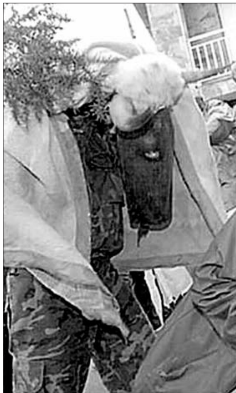
A figura que en Laza se coñece como “a morena” é unha representación que coincide co deus italo Fauno Lupercos.

As pantallas de Xinzo (na imaxe) forman parte do conxunto de figuras que saen por estas datas en Galicia, na franxa xeográfica que se coñece como “o cinto do Entroido”, e que teñen a súa orixe nas festas da antiga Roma.